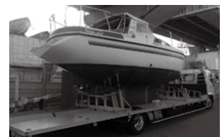
荷台をできる限り低く設定しており、ヨットの陸送にも安定感抜群だ