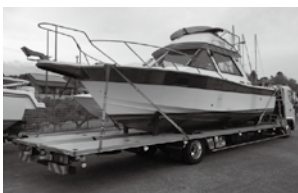
ボートの陸送だけでなく、商品の仕入れにも活躍する浜寺ボートのトラック

2年後には創業50年の節目を迎えようとしている同社、今後のさらなる飛躍に期待しよう。