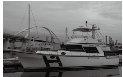
曳航専用タグボートは特別仕様。アフタデッキには曳航用ビットも備える

「昨年度、陸送用トラックを新しくしました。全体で12m、荷台長さを9.7mと先代トラックよりも少しですが長くなりました。一方で荷台の高さをなるべく抑えることで、より安定してヨットやボートが運べる仕様になっています。弊社の仕入れにも活躍していますし、全国